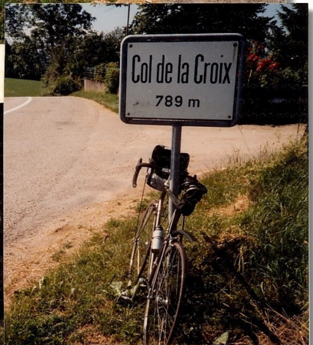
Der 'Giftige' ist bezwungen