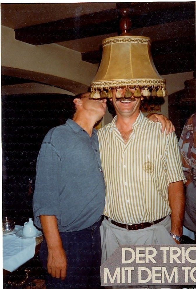
DER TRICK MIT DEM TOPF